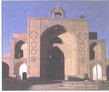
Kirman'da Mescid-i Melik'in ana yanvanı

Yüzölçümü 168.472 km 2 olan, 2.182.300 nüfusa sahip Kirman idarî bölgesi (ostân) Kirman, Bem, Zerend, Rafsencân, Sircan, Şehribâbek, Berdsîr, Bâft, Sebzeverân (Cîruft) ve Kohnuc adlarındaki on şehristana ayrılmıştır.