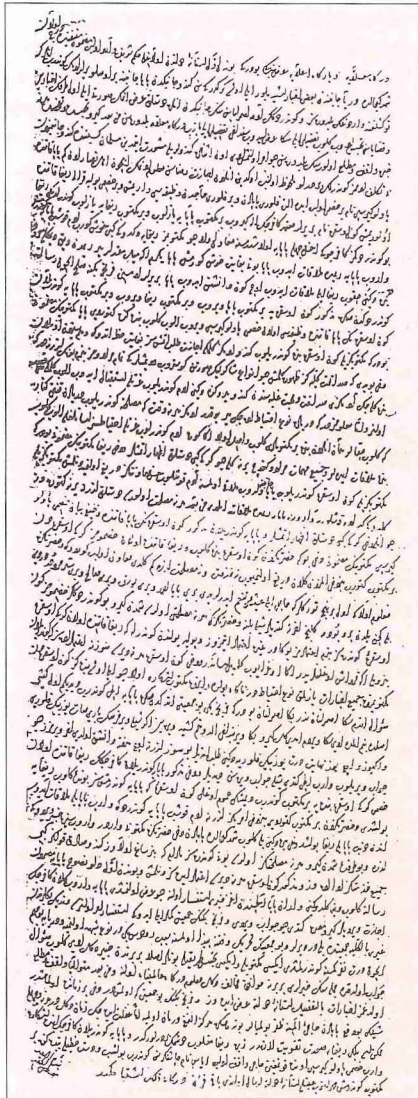
Koca Mustafa Paşa'nın kapıcıbaşı İken Cem Sultan hakkındaki yazdığı rapor (TTK Belleten, XXIX/95, s. 481-482)