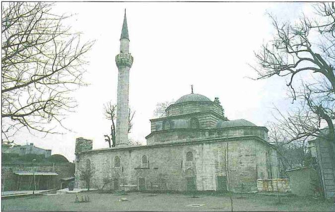
Koca Mustafa Paşa Camii – İstanbul

Yapıda hristiyan - Ortodoks litürjisi gereklerine uygun biçimde iç mekân birbirinden tecrit edilmiş mekânlara bölünerek ummun ibadeti için yalnız ortada kubbe altında bir bölüm bırakılmıştı. Kiliseyi cami haline getiren Osmanlı mimarı mihrabı kible istikametine göre ayarlamak ve mihrabı mümkün olduğunca her açıdan görülebilir bir hale getirmek zorundaydı. Bu sorunu çözmek için binanın