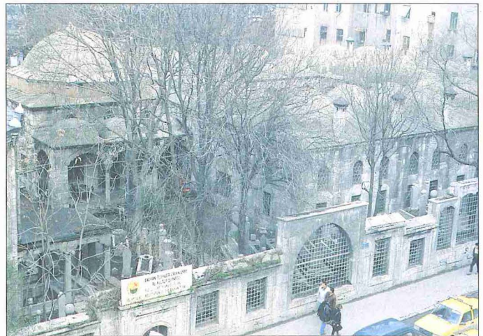
Koca Sinan Paşa Medresesi – Beyazıt / İstanbul

ve kapısının önü sundurmali bir yapıdır. Sundurma, beş adet zarif sütunçeye oturan kemerler vasıtasıyla taşınmaktadır. Giriş cephesinin dışındaki cepheler alttakiler dikdörtgen biçimli ve sivri kemerli, üsttekiler almaşık kırmızı-beyaz taşlarla örülmüş yuvarlak kemerli olan çift sıra pencerelerle hareketlendirilmiştir. Dar saçaklı kubbe eteğinde yapıyı çepeçevre dolanan mukarnaslı bir kuşak ve onun üstünde palmet dizili bir friz göze çarpar. İki mermer lahitte üç ahşap sandukanın bulunduğu türbenin içi ise çok yalın görünümlüdür. Türbenin etrafı ve medrese ile ihata duvarı arasında kalan