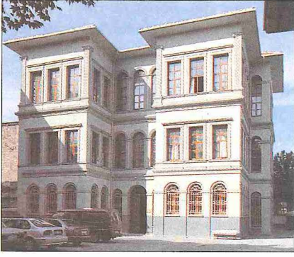
Günümüzde Vefa Lisesi olarak kullanılan Mütercim Rüşdü Paşa Konağı – İstanbul

leve hizmet edecek şekilde donanmış olmakla birlikte yapısı itibarıyla bir konak olan, Sultan Abdülmecid tarafından yaptırılan 1844 tarihli binasında da kapıların doğrudan sokağa açıldığı görülmektedir.