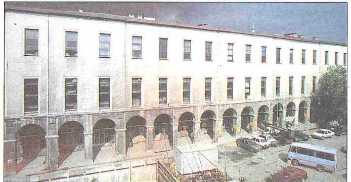
Günümüzde İstanbul Üniversitesi Eczacılık Fakültesi olarak kullanılan Fuad Paşa Konağı (restorasyondan sonra) – Beyazıt / İstanbul

Konaklardaki malzeme tercihi, taşlık kısmını içeren zemin katı dışında İstanbul için büyük oranda ahşap malzeme üzerinedir. Zemin katın duvarları ise çoğunlukla taş malzeme ile mümkün mertebeye açılımsız olarak oluşturulmakta, bunun üzerine ahşap karkaslı bina kütlesi inşa edilmektedir. Zemin katın sağır kurgusuna karşılık üst katlarda eliböğründelere oturan çıkmalar, cumbalar, kafeslerle örtülen çok sayıda pencere ve geniş saçaklarla son derece hareketli bir görünüm sergilenmekteydi. Yangınların meydana getirdiği büyük tahribata ve 1660'taki Cibali yangınından sonra ahşap ev yapımına izin vermeyen fermana rağmen bu tercih hiçbir şekilde değişmemiş, XIX. yüzyılın ikinci yarısında inşaat tekniğindeki gelişmelerle artan kâgir malzeme kullanımını bile ahşabın yanında sönmük kalmıştır. Zeynep Hanım Konağı, 1867'de yaptırılan ve bugün İstanbul Üniversitesi'nin Eczacılık Fakültesi'ne ev sahipliği yapan Fuad Paşa Konağı, bu üniversitenin Tıp Tarihi Enstitüsü'nün bulunduğu Subhi Paşa Konağı, Vefa Lisesi'ne ev sahipliği yapan Mütercim Rüşdü Paşa Konağı, Millî Eğitim Müdürlüğü'nün bulunduğu Rauf Paşa Konağı kâgir malzeme ile oluşturulmuş önemli konaklardandır. Bununla birlikte kâgir bir yapı olan Âli Paşa