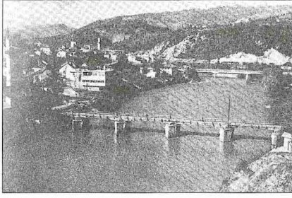
Konice Neretva Köprüsü'nün yıkırdıktan sonraki hali

kasabada % 51'e, köylerde ise % 54'e geriledi.