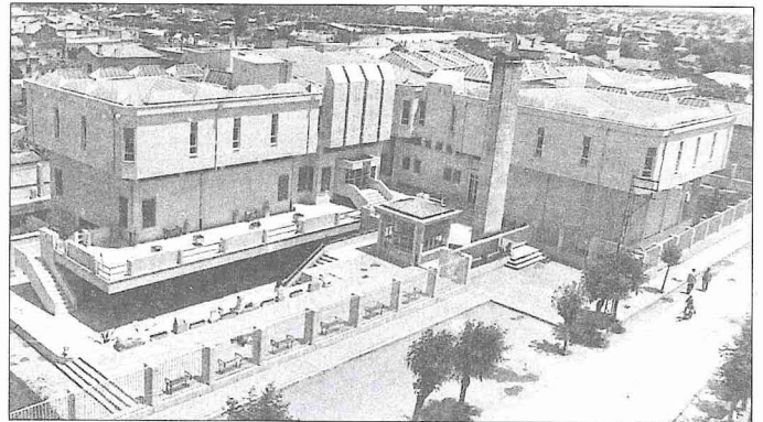
Koyunoğlu Müze ve Kütüphanesi - Konya

Bursa'nın merkezinde Çarşı bölgesindeki Ulucami ile Orhan Gazi İmareti arasında bulunmaktadır. Eski kaynaklarda adı Yeni Han, Beylik Hân-ı Cedîd-i Âmire, Hân-ı Cedîd-i Evvel, Sîmkeş, Sırmakeş Beylik Kervansaray şeklinde de geçmektedir. Bazı kaynaklarda İpek Hanı olarak adlandırılan yer de burası olmalıdır. Hanın bir inşa kitâbesi yoktur. Fakat İstanbul'da II. Bayezid için inşa edilen büyük cami ve külliye Vakıflar Genel Müdürlüğü'ndeki 911 (1505) tarihli vakfiye sûretine göre bu külliyenin evkafından olmak üzere hanın 895 Rebülâhîrinde (Mart 1490) yapımına başlanarak 896 Zilkadesinin 25'inde (29 Eylül 1491) açılışı yapılmıştır. Ancak Rıfık Melûl Meriç'e göre han İstanbul'daki külliye inşasından on yıl önceye ait olduğuna göre onun evkafından olamaz. Vakfiyede adı geçen kervansaray Koza Hanı değil yakınındaki Piriç Hanı olmalıdır. Yine Meriç'in tesbitine göre Koza Hanı'nın yeri muhtelif kimselerden 895 Rebülâhîrinde (Mart 1490) satın alınmıştır. Hanın mimarı Abdülahî b. Puladşah'tır. Kâzım Baykal, Bursa şer-