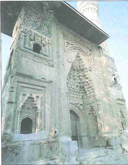
Kölük b. Abdullah'ın inşa ettiği Sâhib Ata Camii'nin taç kapısı

Kölük b. Abdullah'ın inşa ettiği eserlerin başında Konya'daki Sâhib Ata Külliyesi gelmektedir. Cami, türbe, hankah ve hamamdan oluşan yapılar topluluğunun inşasına 656'da (1258) başlanmış ve 678'de (1279) tamamlanmıştır. Külliye'nin bânisi olan Sâhib Ata Fahreddin Ali'ye ait türbe binasının 682'de (1283) yenilediği anlaşılmaktadır. Yapılar topluluğunun mimarının adı, taçkapının sağında sebil nişinin köşe dolgularındaki iki madalyonun içine "amel-i Kölük b. Abdullah" şeklinde kaydedilmiştir. Sanatçının ikinci eseri Konya'daki İnce Minareli Medrese'dir. Medrese ve günümüze gelmeyen bir mescidden oluşan yapının inşa kitâbesi yoktur. Ancak vakfiyesine dayanarak 663 (1265) yılında yapıldığı kabul edilmektedir. Bu yapı da Sâhib Ata Fahreddin Ali tarafından yaptırılmıştır. İki üniteli külliye'nin mimarının adı taçkapıda, büyük kemerin üstündeki yarım daire şeklinde aşağıya sarkan kabartmanın sağında ve solundaki madalyonların içinde "amel-i Kölük b. Abdullah" şeklinde okunmaktadır. Kölük b. Abdullah tarafından inşa edildiği kitâbesinden kesin biçimde öğrenilen Konya'daki Nalınca Baba /