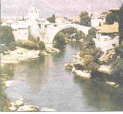
XVI. yüzyılın ikinci yarısına ait Mostar Köprüsü

tan) Arta Köprüsü (XV. yüzyıl), Maraş Ceyhan Köprüsü (XVI. yüzyıl [?]), Konjic (Bosna - Hersek) Karagöz Mehmed Bey Köprüsü (XVI. yüzyıl), Mostar Köprüsü (1557-1567), Trebinje (Bosna - Hersek) Arslanağa Köprüsü (981/1573-74), Podgarica (Yugoslavya) Vezirköprü (XVI. yüzyıl), Larisa-Yenişehir (Yunanistan) Hasan Bey Köprüsü (XVI. yüzyıl), Edirne Ekmekçi-zâde Ahmed Paşa Köprüsü (XVII. yüzyıl), Babaeski Köprüsü (1633), Çorlu Kara Mustafa Paşa Köprüsü (XVII. yüzyıl), Debre (Makedonya) Kaçanikli Mehmed Paşa Köprüsü (XVII. yüzyıl), Buna (Bosna - Hersek) Danyal Paşa Köprüsü (XVII. yüzyıl), Muş Murad Nehri Köprüsü (1817).