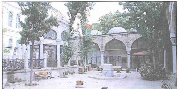
Köprülü Külliyesi'nin avlusundan bir görünüşü

Türbe Divanyolu caddesi üzerinde ders-hane - mescidin doğusunda, medrese odaları ile ders-hane - mescid arasında yer almaktadır. Vaktiyle ders-hane - mescidin kuzeyine yakın bir yerde olduğu tahmin edilen türbenin eski durumu Köprülü Su Yolları Haritası'ndan öğrenilmektedir. Divanyolu'nun 1288 (1871) yılında genişletilmesi esnasında yıkıtılan türbe bugünkü yerinde yeniden inşa edilmiştir. İlk yapının ne şekilde olduğu hakkında ayrıntılı bilgi mevcut olmamakla beraber bugün-