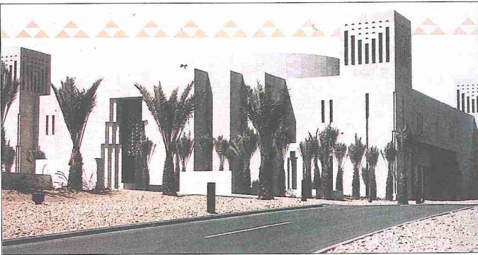
Körfez İşbirliği Konseyi binası - Riyad

Körfez İşbirliği Konseyi kurulduğu tarihten bu yana ekonomik iş birliği, ticaret, endüstri, tarım, haberleşme, ulaşım, enerji, bölgesel güvenlik ve dış ilişkiler alanlarında çeşitli faaliyetlerde bulundu ve bazı önemli kararların alınmasını sağlayarak yürürlük alanına soktu. Bunun