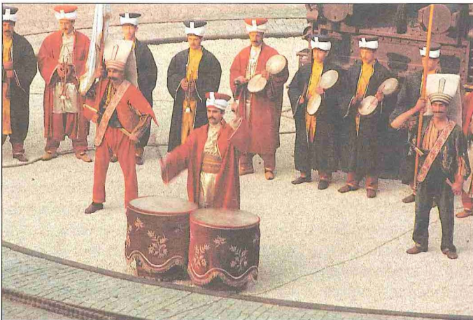
Osmanlı mehterinde kullanılan çift kös