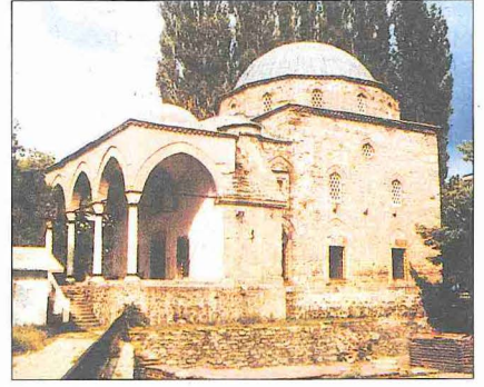
Köstendil'de Feridun Ahmed Bey Camii

983-985 (1575-1577) yılları arasında inşa edilen âbidevî bir cuma camisi olan Ahmed Bey Camii, kısa bir dönem Köstendil sancak beyi olarak hizmet eden Feridun Ahmed Bey'in emriyle yapılmıştır. Mevcut Bulgar kaynakları bu caminin tahrip edilen Saint Paraskevi Kilisesi'nin yıkıntıları üzerine inşa edildiğini ileri sürer. Arkeolojik araştırmalar ise sadece bir geç dönem Roma bazilikasının temellerini ortaya çıkarmış, bunun dışında bir şey bulunamamıştır. Caminin bulunduğu yer,