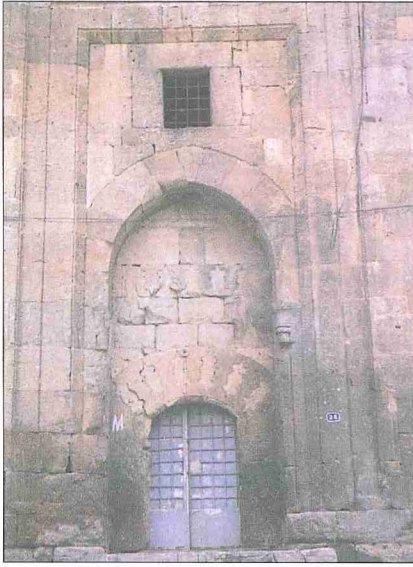
Köşk Hankahı'nın taçkapısı

gen revaklı avlusunun ortasında türbe olan bir Selçuklu ve Beylikler dönemi eserine rastlamak mümkün değildir. Köşk-medrese bu haliyle yegâne örneği teşkil etmekte ve ilim adamlarının dikkatini çekmektedir.