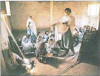
Afganistan'da bir kız Kur'an kursu

1928'deki harf inkılabından sonra gayri resmî Kur'an kurslarıyla sıkı bir mücadeleye girişilmiş, bu arada Tevhîd-i Tedrîsat Kanunu'nun 4. maddesi gereğince açılan imam ve hatip mektepleri ilgisizlik yüzünden 1929-1930 yıllarında kapanmıştır (bk.