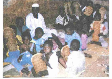
Mali Cumhuriyeti'nin başşehri Bamako'da bir Kur'an kursu (Ahmet Kavas fotoğraf arşivi)

1869'da çıkarılan bir nizamnâme ile rüşdiyelere daha iyi öğrenci yetiştirilebilmesi için sıbyan mekteplerinin programı elifbâ, Kur'an, tecvid, ahlâk, ilmihal, yazı, hesap, muhtasar Osmanlı tarihi, coğrafya ve "ma'lûmât-ı nâfia" şeklinde düzenlenmiştir. Bu sıralarda İstanbul'da 360 kadar sıbyan mektebi bulunduğu belirtilmektedir ( Türkiye Maarif Tarihi , I, 89; II, 464). Sıbyan mekteplerinin giderek önemini kaybettiği Tanzimat ve Meşrutiyet dö-