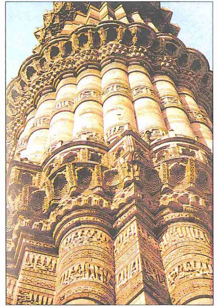
Kutub Minâr'ın gövdesinden bir detay

Orta Asya'daki benzerleri gibi müstakil bir yapı halinde ortaya konulan Kutub Minâr gittikçe daralan beş katlı bir gövdeye sahiptir ve her katın arasında mukarnaslar ve yazı kuşaklarıyla bezenmiş dört şerefe bulunmaktadır. Sultan İltutmış tarafından dört kat halinde tamamlanan