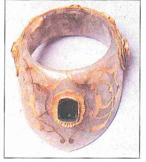
XVI. yüzyılın ikinci yarısına ait zümrütlü yeşim ok yüzüğü (TSM, nr. 2/83)

İlk devir İslâm kuyumculuğundan günümüze fazla bir örnek ulaşmamıştır. Bulunan en eski eserler, V. (XI.) yüzyılın ilk yarısına tarihlenen İslâm coğrafyasının doğu veya batısına ait birkaç parça ziynet eşyasından ibarettir. İslâm tarihinin ilk üç dört asrındaki takılar, dolayısıyla o dönemlerin kuyumculuğu hakkında sahip olunan bilgiler, daha çok bazı saray kalıntılarından ortaya çıkarılan heykel ve kabartmalarla edebî metinlere dayanmaktadır. Ele geçen tasvirler, ilk dönem kuyumculuğunda önemli ölçüde Roma-Bizans ve Sâsânî etkisi olduğunu göstermektedir. V. yüzyılda yaşayan Reşid b. Zübeyr el-Kâdî tarafından yazılan eğ-Zeğâ’ir ve’t-tuhaf ’ta Emevî ve Abbâsî devlet adamlarına gelen hediyeler arasında çok değerli taşlardan, “yetime” denilen olağan üstü büyük incilerden, altın ve gümüşten yapılmış eşyadan söz edilir. İlk dönem İslâm takılarında görülen orijinal bir özellik yazının süs unsuru olarak kullanılmasıdır (Allan, s. 60-61). Mevcut örneklerden Rakka’da (Suriye) bulunan V. (XI.) yüzyıla ait altın levhalardan yapılmış ve granüle-telkâri bezemelerle süslenmiş bir bileziğin kilidinde doğru incelen halkalarında iyi dilekler içeren küfî yazılar yer almaktadır. Bu bileziğin bir benzeri Abbâsî Halifesi