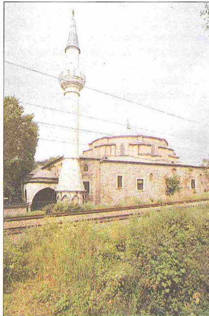
Küçük Ayasofya Camii ve içinden bir görünüşü

Topkapı Sarayı Arşivi'ndeki belgelerden (nr. D 9567) Küçük Ayasofya Camii'nin 1648 ve 1766 depremlerinde zarara uğradığı anlaşılmaktadır. Mâbed XIX. yüzyıl içinde de bazı tamirler geçirmiş olmalıdır. Eski fotoğraflarda görülen sıvalarla pencere etrafındaki beyaz şeritler herhalde bu son tamirden kalmıştır. Küçük Ayasofya Külliyesi'ne en büyük zararı veren olay, 1860'larda cami ile çok yakın olan surlar ve deniz kıyısı arasındaki pek dar kıyı şeridinden Avrupa demir yolunun geçirilmesi olmuştur. Bu yol elli yıl sonra çift hat olarak genişletilmiş, yolun yüksekte bulunması gerektiğinden külliye iyice çukurda kalmıştır. Ayrıca şehir topografyasının değişmesi, kuzey-güney istikametinde cami avlusunun bir sokak gibi kullanılmasına yol açmış, yakın yıllarda belediyenin avlunun bu kesimine parke taş döşemesiyle cami, avlusundaki zâviye-medreseden ayrı kalmıştır.