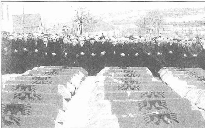
15 Ocak 1999'da Reçak'taki (Kosova) katliamdan sonra kılınan toplu cenaze namazı