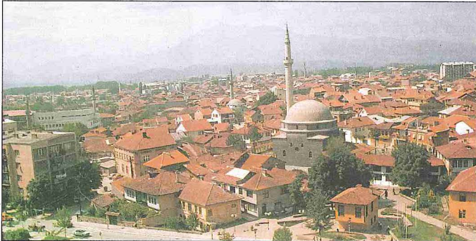
Priştine ve Prizren'den iki görünüş