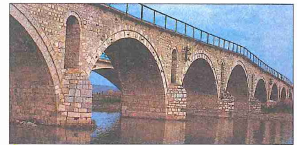
Gjakova - Prizren yolu üzerindeki Terzi Köprüsü

Kosova bölgesi, XVII. yüzyılın başında idarî taksimat bakımından kuzeyden Bosna, güneyden Rumeli eyaletinin sınırları içinde yer alıyordu. 1659-1660 yıllarında Kosova ovasından geçen Evliya Çelebi, Vulçitrin kasabasının 2000 hânelik sancak merkezi olduğunu, halkının Türkçe ve Arnavutça konuştuğunu, fakat Girit seferi dolayısıyla şehrin canlılığını kaybettiğini yazmaktadır ( Seyahatnâme , V, 550 vd.). Kosova sahrası, Osmanlı hâkimiyetine geçişinden yaklaşık iki buçuk asır sonra kısa bir süre için Avusturya istilâsına mâruz kaldı. 1683 Viyana bozgunu üzerine Macaristan'ı işgal eden Avusturya ordusu 1688-1689'da Balkanlar'a girmiş ve Sırp'ların da yardımıyla Kosova ovasını zaptetmişti. Burası o esnada, geçici olarak Rumeli valiliğine getirilen Celâlî eşkıyabaşısı Yeğen Osman Paşa'nın tahakkümü altında bulunuyordu. Avusturyalılar, Kumanova merkez olmak üzere burada bir Sırp krallığı kurma girişiminde bulunmuşlarsa da (Râşid, II, 94-95) bu topraklar, çok geçmeden Mora seraskeri Koca Halil Paşa ve Kırım Hanı Selim Giray'ın Avusturyalılar'a karşı kazandıkları zaferle tekrar Türkler'in eline geçmiştir (1690). Bu olaylardan yaklaşık bir asır sonra Buşatlı Arnavut ailesinden İşkodra mutasarrıfı Kara Mahmud Paşa devlete kafa tutmaya ve Kosova'da bazı idarî işlere müdahale etmeye başlamıştı. 1786'da I. Abdülhamid tarafından "fermanlı" ilân edilen Mah-