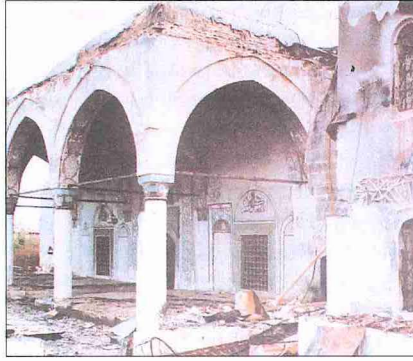
1999 savaşında Gjakova'da (Kosova) Sırp lar tarafından tahrip edilen tarihî Hadum Camii'nin son cemaat yeri

Günümüzde Balkan yarımadasının ortasında kuzeybatıdan güneydoğuya doğru uzanan Kosova'nın yüzölçümü 10.877 km 2 olup başşehri Priştine'dir (Prishtinë). Kuzeydoğu ve doğusunda Sırbistan, kuzeybatısında Sancak, batıda Karadağ ve Arnavutluk, güneyde Makedonya ile sınırlanmaktadır. 2.500.000'e yakın nüfusu olan Kosova halkının çoğunluğunu Arnavutlar oluşturur. Arnavutlar'ı Sırp lar ve Türkler takip eder; ayrıca Boşnak, Hırvat