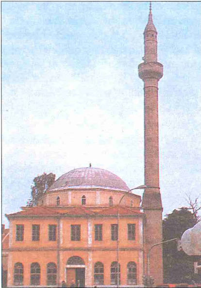
Priştine'de Sultan Murad (Çarşı) Camii – Kosova

Çirmen savaşıyla (1371) Balkanlar'a doğru ilerlemeye başlayan Osmanlılar'ın bu kesimde XX. yüzyılın başlarına kadar sürecek olan hâkimiyetlerinin iki önemli dönüm noktasını oluşturan bu savaşlar aynı yerde yapıldığı için kaynaklarda I ve