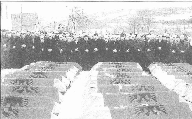
15 Ocak 1999'da Reçak'taki (Kosova) katliamdan sonra kılınan toplu cenaze namazı

II. Dünya Savaşı esnasında 1941'de Kosova'nın büyük bir kısmı, dönemin faşist İtalyası ile iş birliği içerisinde olan Arnavutluk'a ilhak edildi. Mitrovica, Podujeva, Vushtrria ve Tregu i Ri bölgeleri Hitler Almanyası tarafından işgal edilip Almanyaya iş birlikçisi olan Nedić'in idaresindeki Sırbistan'a verildi. Kaçanik, Vitia, Preşova, Üsküp, Kumanova ve Gilan'ın bir kısmı Bulgaristan'a katıldı. Savaşın sona Tito liderliğinde kurulan yeni idare Kosova'daki müslüman gruplar için ümit verici olmadı. Yugoslavya Komünist Partisi nezdinde fazla üyesi bulunmayan müslümanlara savaş döneminde düşmanla iş birliği ve savaş zengini gibi suçlar yüklenip aydın kesimin büyük bir kısmı yargılandı. 1945 yılının Şubat ayında Sırp Devleti Kosova'da olağan üstü hal ilân etti. Aynı yılın temmuz ayında Yugoslavya Devleti tarafından Prizren'de tertiplenen bir toplantıda Kosova'ya Sırbistan Cumhuriyeti sınırları