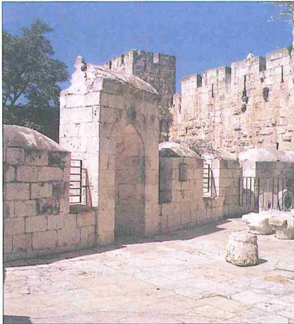
Dâvud Kulesi'nin içindeki namazgâh

Mi'raç kandiline denk düşen 27 Receb 583 (2 Ekim 1187) Cuma günü Selâhaddin Kudüs'e girdi. Haçlılar'ın seksen sekiz yıl önce buldukları şehirde hiçbir taşkınlık yapılmadı; müslümanlar zafer sevincini olgunluk içinde kutladılar. Haçlılar Kudüs'ten çıkıp giderken Ortodoks ve Ya'kübî hristiyanlar şehirde kaldı. Müseviler'in de şehre yerleşmesine izin verildi. Hristiyanlara ait kutsal yerlerin idaresi Ortodoks kilisesine teslim edildi. Bir süre Kudüs'te kalan Selâhaddin-i Eyyûbî, Haçlılar tarafından saray olarak kullanılan Mescid-i Aksâ'yı camiye çevirdi ve Templier tarikatının yaptığı