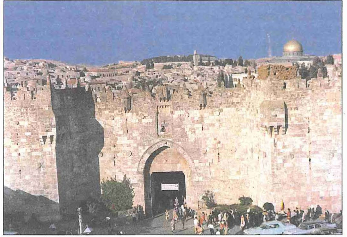
Kudüs surlarının Şam Kapısı

Kudüs şehrini modernleştirmeye çalıştı. 1863'te Kudüs Belediyesi teşekkül etti, sancak yönetimini düzenlemek üzere bir idare meclisi kuruldu. Kudüs Belediyesi şehrin temizliği, kanalizasyon sistemi, aydınlatılması, sokakların tanzimi ve ağaçlandırılması gibi alanlarda önemli hizmetler verdi ve 1891'de belediye hastahanesini hizmete açtı. 1886'da Kudüs polis gücü oluşturuldu. 1900'de Yafa Kapısı'nın yakınına bir sebil, kapının üzerine de saat kulesi inşa edildi. Müze ile Türkçe, Arapça ve Fransızca oyunların sergilendiği tiyatro da diğer kültürel yatırımlardandır.