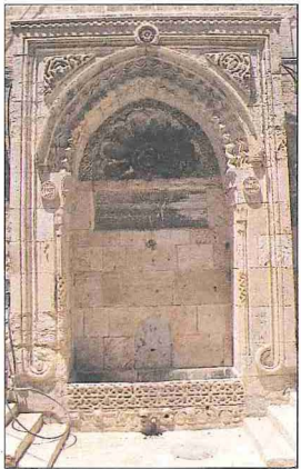
Kudüs'te Babü'ssilâle'nin önündeki Kanûnî Sultan Süleyman dönemine ait çeşme

Osmanlı Devleti, Kudüs'ü birçok yönden derinden etkileyecek olan bu gelişmelere karşı bir taraftan Avrupa'nın müdahalelerini sınırlandırmaya, diğer taraftan da