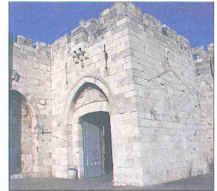
Kudüs surlarının Yafa Kapısı

XIX. yüzyılın ilk çeyreğindeki siyasî gelişmeler Kudüs'ü etkiledi. 1807'de Kudüs'ü de içine alan isyan Sayda Valisi Süleyman Paşa tarafından bastırıldı. Bölgede gelişen Vehhâbî tehlikesine karşı 1810 yılında Sayda Valisi Süleyman Paşa Kudüs sancak beyliği görevini de üstlendi. 1821'deki Yunan isyanı Kudüs'te özellikle Rum Ortodokslar arasında hareketlenmelere yol açtı, ancak yetkililerin sıkı tedbirleriyle çatışma çıkması önendi. 1825'te merkezî yönetimin zaafından yararlanmak isteyen Kudüs civarındaki bazı köyler askere gitmemek ve vergi ödememek için bir isyan başlattılar; Remle-Kudüs arasında etkili olan bedevî şeyhlerinden İbrâhim Ebû Goş'un da desteğini alarak kısa sürede şehri ele geçirdiler. Sayda Valisi Abdullah Paşa isyancıları ikna ederek 1826 sonlarında sükûneti sağlayabildi.