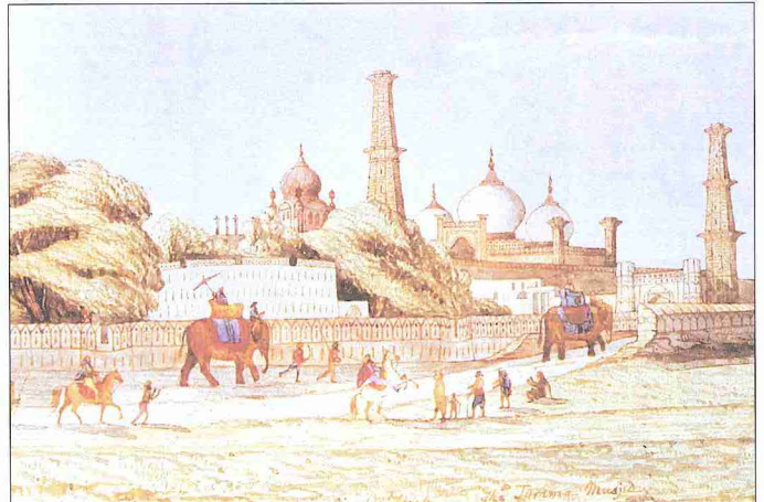
Lahor'un 1846 yılına ait bir gravürü

İngiliz hâkimiyetinde Pencap eyaletinin merkezi olma durumunu sürdüren Lahor'da hızlı bir şekilde İngiliz kurumsallaşması yaşanmaya başlandı. Eski şehir geleneksel yapısıyla devam ederken bir taraftan da İngilizler'in idarî ve sosyokültürel ihtiyaçlarını karşılayacak Hindî, İslâmî ve Avrupaî özellikler taşıyan yeni binalar yapıldı. 1857 olaylarından sonra İngilizler'in uyguladığı ayırıcılığın etkisiyle şehirdeki müslümanlar ekonomik ve sosyal hayatta çok gerilerde kaldılar. Lahor, 1875'te kurulan ve Hindu milliyetçiliğini savunan Arya Samaj hareketinin önemli merkezlerinden biri haline geldi. Buna karşılık müslümanlar da 1895'te Encümen-i Himâyet-i İslâm teşkilâtını kurdular. 1907'de Müslüman Birliği'nin Lahor şubesi faaliyete geçti. Lahorlular daha sonra Hindistan Hilâfet Hareketi içerisinde yoğun faaliyet gösterdiler. 23 Mart