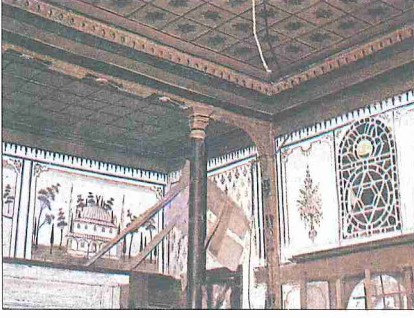
Latifoğlu Konağı'nda kalemkâri manzara, meyve ve çiçek bezemeleri

Odaların çivisiz olarak tamamen geçme tekniğinin başarıyla uygulandığı, rölyef tarzında yüksek kabartma motiflere sahip kapıları kayda değer örneklerdir. Özellikle bey odasının tavan süslemesi ön plana çıkar. Ahşap bezemeli tavanın zengin bordürlerle çevrili, aşağıya doğru sarkıt şeklinde uzanan yivli göbeğiyle son derece zengin bir görünüm meydana getirilmiştir. Aynı odada yer alan ocağın davlumbaz kısmında küçük nişler ve iri yaprak motiflerinden oluşan alçı süsleme görülür. Ayrıca alt katta bey odasının altına gelen, doğu yönündeki oda süsleme özellikleri açısından dikkat çekicidir. Burada, yine tavanda yoğunlaşan ahşap süslemelerin dışında duvarlarda bazı kısımlarda çift sıra halinde olmak üzere cami, manzara, meyve, çiçek buketi tasvirli resimlere yer verilmiştir. Gerçekçi bir anlayışın hâkim olduğu bu çok renkli kompozisyonlar benzerlerine Anadolu'da XVIII.-XIX. yüzyıllarda cami, ev gibi yapılarda rastlanan örneklerdir. Odadaki ocağın davlumbazı ve dayandığı duvar, Osmanlı çinilerinin desenlerini hatırlatır tarzda tekrarlanan çiçekli vazo motifleriyle tekstil karakterli bir bezemeye sahiptir. Bezeme alçı üzerine renklendirilerek uygulanmıştır.