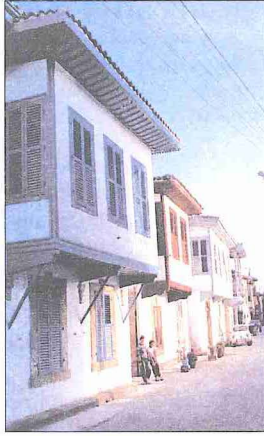
Lefkoşe'de Arap Ahmed Paşa mahallesindeki eski Türk evleri

XVI. yüzyılda dünya ticareti ağırlığının Atlantik'e kayması, Venedikliler'in sıkı askerî yönetimi, sık sık yaşanan kuraklık ve çekirge saldırıları, büyük depremler (1480, 1542), veba salgınları ve Osmanlılar'ın Suriye ile Mısır'ı alarak ticaretin Halep üzerine kaymasına yol açmaları gibi sebeplerle, Lefkoşe fethedildiğinde ekonomik canlılığını ve zenginliğini tamamen kaybetmiş durumda idi. 1572 tarihli tahrir sonuçları da bu hususu doğrulamakta ve şehirden elde edilen gelirler toplamının sadece 150.000 akçe olduğunu göstermektedir. Fetihle birlikte Osmanlı Devleti bu kötü durumu değiştirmek için yoğun bir çalışma içine girdi. Bu çalışmanın olumlu sonuçlar verdiği ve şehrin XVII. yüzyılın ortalarına doğru ekonomik bakımdan canlandığı Dedoyn, Sandys ve Lithgow gibi Batılı seyahatçilerin anlattıklarının yanında mahkeme kayıtlarından ve narh listelerinden anlaşılmaktadır. Bu belgeler üzerindeki araştırmalar şehrin çevresinde yoğun bir ziraatın, şehirde de ticaret ve imalâtın varlığına işaret etmekte ve arpa, buğday, mısır, nohut, pamuk ve ipek, yoğurt, peynir, pekmez, yağ, suçuk, pastırma, üzüm, incir, zeytin, leblebi