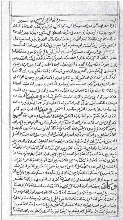
İbrâhîm el-Lekânî'nin Cevheretü'l-tevhid 'ine bizzat yazdığı ' Umdetü'l-mürîd li-Cevheretü'l-tevhid adlı şerhin II. cildi-nin ilk ve son sayfaları (Hacı Selim Ağa Ktp., nr. 624)

el-Gayşî, Hüseyin el-Hafâcî ve Ahmed b. Ahmed el-Acemî gibi âlimler sayılabilir. Süfülîğe temayülüyle de tanınan Lekânî'nin 144 beyitten oluşan Cevheretü'l-tevhid adlı risâlesini, şeyhi Ebû'l-Abbâs Şehâbeddin Ahmed b. Osman eş-Şernûbî'nin işaretleriyle bir gecede yazdığı rivayet edilmektedir. 1041 (1632) yılında hac farızasını yerine getiren Lekânî dönüş yolu üzerindeki Akabe (Eyle) yakınlarında vefat etmiş ve öldüğü yerde defnedilmiştir (Muhibbî, I, 9).