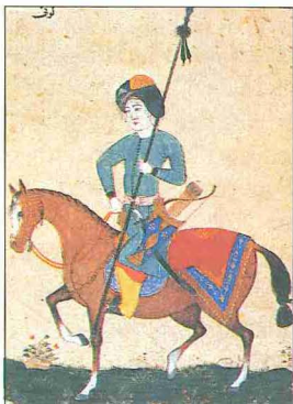
Levnî'nin bir sùvari minyatürü (TSMK, Albüm , Hazine, nr. 2143, vr. 13*)

Mekke'de bu sûrenin indiği dönemde varlıklı müşrik Araplar, yoksullar karşısında insanlıkla bağdaşmayacak derecede