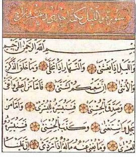
Leyl sūresinin nesih hattıyla yazılmış ilk âyetleri

bencil ve duyarsız davranıyor, hatta Kur'an-ı Kerim'in beyanına göre (Yâsîn 36/47), "Allah'ın doyumadıklarını biz mi doyuracağız?" diyorlardı. Bu sebeple diğer birçok benzeri gibi Leyl sūresinde de temel hedef, Allah'ın birliği inancının yanında sıkıntıların ve nimetlerin paylaşılabilirdiği toplumsal bir ruh ve zihniyeti geliştirmek olmuştur. Sūrede, Allah'ın kendilerine bildirdiği iman esaslarını ve davranış ilkelerini tasdik edip insanlara iyilik ve cömertlikte bulunanlar övülmüş, bunların ilâhî yardıma, dünya ve âhiret kurtuluşuna kavuşacakları müjdelenmiştir. Bunun yanında Allah karşısında bile kendilerini ihtiyaçsız sayacak kadar küstahlaşıp cimrilik yapanların Allah'ın hidayet ve yardımından mahrum bırakılacakları, böylece günah işlemelerinin daha da kolaylaşacağı, sonuçta "alev alev yanan ateş"i boylayacakları bildirilmiştir.