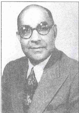
Liyâkat Ali Han

Osmanlılar Lofça'yı alınca kaleye bir askerî garnizon yerleştirdiler. Şehir ve kale, 1444'teki Varna savaşı sırasında Haçlı ordusu tarafından tahrip edildi ( Gazavât-ı Sultân Murâd bin Mehemed Hân , s. 45). Savaşın ardından kasabanın yukarı kısımlardaki yıkılan bölümü tekrar inşa edilmedi. Osmanlı döneminde Lofça, Osum Irmağının bir bükümünde içindeki kalenin altında yer alan düz arazide gelişmesini sürdürdü. 1444'ten sonra buraya Anadolu'dan Türk gruplar getirilip yerleştirildi. Niğbolu sancağının 884 (1479) tarihli en eski tahrir defterlerine göre Lofça'da 124 hıristiyan hânenin dışında elli bir hâne müslüman Türk