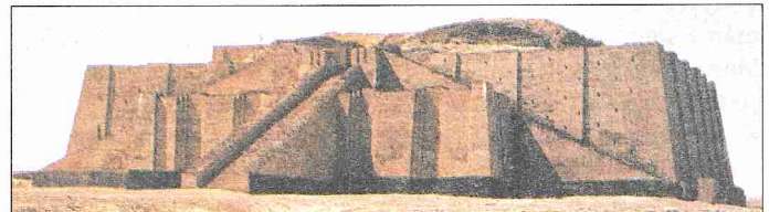
Tarihi Ur şehrindeki Nanna Zigguratu – Irak

Sumerler, insanların ilâhlara kurban takdim etmek ve mâbed yapmak için yaratıldıkları inancından hareketle tanrılara mâbedler yapmışlardır. Sumer mâbedleri tanrıların ikamet yeri ve orada bulunuşlarının somut göstergesiydi. Bütün mâbedlerde tanrının heykelini korumak için bir iç oda ve kurban takdim etmek için de bir mezbah (altar) bulunurdu. Her tanrının, mâbedine hizmet eden ve günlük ihtiyaçları için orada hazır olan bir rahibi vardı.