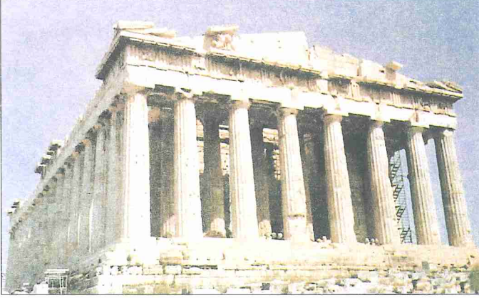
Milâttan önce V. yüzyıla ait bir Yunan mâbedi olan Parthenon – Atina / Yunanistan

Bâbil ve Asurlular'da mâbedin iç kısmında yer alan tanrı heykeli onun oradaki varlığını sembolize ederdi. Sumer, Bâbil ve Asurlular'da alışılmış mâbedlerin dışında mâbedlere bitişik olarak yapılmış, "ziggurat" (ziqurat) adı verilen mâbed kuleleri olurdu. Taraçalar şeklinde kat kat yükselen, bir tanrı adına tuğladan yapılmış yapılardan ibaret olan zigguratların tepesinde tanrıya ayrılmış, içinde tanrının sûretinin yer aldığı bir oda bulunurdu. Kitâb-ı Mukaddes'te zikredilen Bâbil Kulesi'ne (Tekvîn, 11/1-9, 28/12) Marduk'un Bâbil'deki zigguratının model olduğu söylenmektedir. Muhtemelen bu kule, tanrıların dünyası ile insanlar arasında bir bağ ve aynı zamanda kozmik bir dağ olarak kabul edilmiştir; zigguratların yapımındaki temel düşünce tanrıyı insanlara yaklaştırmaktı.