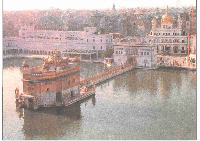
"Altın Tapınak" adıyla tanınan ünlü Sih mâbedi - Amritsar / Hindistan

ist dinî binaları veya bina grupları için "kung" (manastır veya saray), "kuan" (manastır mâbedi) ve "miao" (mâbed) kelimeleri kullanılır. Sayısız tanrı ve tanrılaştırılmış kahraman tasvirlerini ihtiva eden Taoist mâbedlerinin pek çoğu 1911 devriminden sonra tahrip edilmiştir.