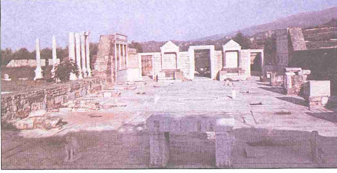
Anadolu'da inşa edilen ilk Müsevî mâbedlerinden Sardes Sinagogu – Salihli / Manisa

Hız. Mûsâ, çöl hayatı boyunca İsrâiloğulları'nın bütün dinî faaliyetlerini buradan yönlendirdiği gibi yahudiler de başta kurban olmak üzere bütün ibadetlerini burada yerine getirirlerdi. Çadira kutsiyet kazandıran önemli hususlardan biri Tanrı'nın orada İsrâil halkı arasında ikamet ettiğine dair inanç, diğeri de ahid sandığının çadırın en kutsal bölümünde muhafaza edilmiş olmasıdır. Bu sebeple sandığı içinde bulunduran çadira "şehâdet çadırı" da (mişkan ha-'Edut, ohel ha-'Edut) denilmiştir (Sayılar, 18/2). Dikdörtgen şeklindeki çadır kutsal mekân ve kudsü'lakdes olmak üzere iki kısma ayrılmıştı. Kapısı doğuya açıldı, kutsal mekânın etrafını çeviren bir de açık avlu vardı (Çıkış, 27/9-19). Toplanma çadırı Süleyman Mâbedi'nin tam yarısı kadar olup onun yapımında model kabul edilmişti. Toplanma çadırı, İsrâiloğulları Ken'ân topraklarına girdikten sonra da uzun süre kullanılmış olup Hâkimler döneminde Şilo'ya (Yeşu, 18/1), Saul döneminde Nob'a (I. Samuel, 21/1), daha sonra Gibeon'a taşınmış (I. Tarihler, 16/39), nihayet Kral Süleyman onu mâbedin içine koymuştur (I. Krallar, 8/4).