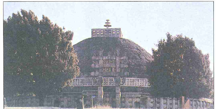
Milâttan önce III. yüzyıla ait Büyük Stupa – Sanci / Hindistan

Jainizm'de Mahavira ve daha önce yaşamış Tirtankaralar adına mâbedler inşa edilmiş, sûretleri de mâbedlerde merkezî bir yere konulmuştur. İbadette tasvirlerin kullanılmasına onların örnek yaşayışları sebep olmuştur. Tirtankaralar'a