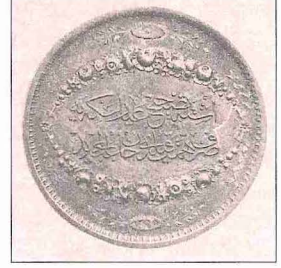
Tashih-i ayar madalyası

yazılı Paris'te yapılmış küçük, kurşundan bir madalya daha vardır); 1272 (1855-56) Kars madalyası altın ve gümüş; 1275 (1858-59) Nişân-ı İftihâr altın ve gümüş; 1276 (1859-60) Tahfîs-i can madalyası gümüş ve bakır; 1276 (1859-60) Tahsîn-i hüner ve mârifet madalyası altın, gümüş ve bakır; 1277 (1860-61) Zaptiye çavuşları madalyası gümüştür.