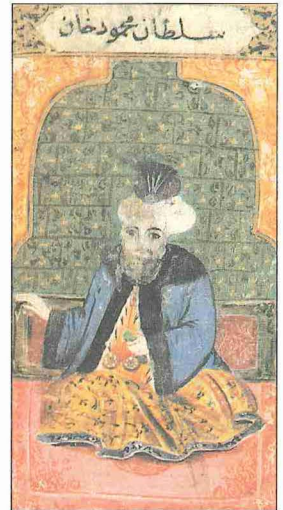
Sultan II. Mahmud (Silsilenâme-i Osmâniyye, İÜ Ktp., TY, nr. 9366, vr. 32*)

13 Ramazan 1199'da (20 Temmuz 1785) doğdu. I. Abdülhamid'in oğludur. Annesi Nakşidil Sultan'ın Fransız asıllı olduğu iddiası doğru değildir. Adlî mahlası doğumuyla birlikte verilmiştir. Ayrıca "büyük" sıfatıyla da anılır. Amcası III. Selim'in tahttan indirilmesi (29 Mayıs 1807), ağabeyi IV. Mustafa'nın cülûsu ve bunun da Alemdar Mustafa Paşa tarafından hal'i üzerine 4 Cemâziyelâhir 1223'te (28 Temmuz 1808) padişah oldu. III. Selim'in katli sırasında ölümden dönmüş olarak darbeler ve karşı darbelerle başlayan saltanatı