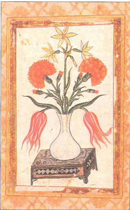
Mahmûd-ı Gaznevî'nin albûmünden çiçek tasvirli bir levha (İÜ Ktp., TY, nr. 5461)

Âlimleri himaye eden Sultan Mahmud'un Şâfiî ve Hanefî fakihlerine huzurunda münazara yaptırdığı bilinmektedir. Âlimlere olan saygısı, adaleti ve iyi yönetimi, gerek kendi döneminde gerekse sonraki devirlerde edip ve şairler tarafından övülmüş, Fars edebiyatında adalet ve insafın timsali olarak gösterilmiştir. Başta Firdevsî olmak üzere Unsûrî, Feruhî-i Sîstânî ve Ascedî gibi şairler onun ihsanlarına nâil olmuşlardır. Bir rivayete göre Firdevsî Şâhnâme 'yi Gazne'ye giderek bizzat ona sunmuştur. Sultan Mahmud'un Şâhnâme 'yi beğenmediği, bunun üzerine Firdevsî'nin ona hicviye yazdığı hakkında bazı kaynaklarda yer alan bilgilerin asılsız olduğu anlaşılmaktadır (Ateş, XVIII/70 [1954], s. 162-168). Farsça'nın büyük bir gelişme göstererek Hin-