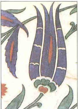
İstanbul'daki Rüstem Paşa Camii'nde lâle desenli bir çini panodan detay

XVIII. yüzyıl Osmanlı kroniklerinde Lâle Devri adı altında bir dönem tanımlaması mevcut değildir. 1718'de Avusturya ve müttefiki Venedik'le imzalanan Pasarofça Antlaşması'nın ardından başlayan uzun barış döneminde başta Halîç ve Boğaziçi olmak üzere iptilâ derecesine varan bir yaygınlıkta lâle yetiştirildiğinden ilk defa Yahya Kemal Beyatlı bu devir için Lâle Devri tabirini kullanmıştır. Tarihçi Ahmed