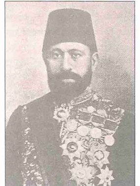
Mahmud Celâleddin Paşa