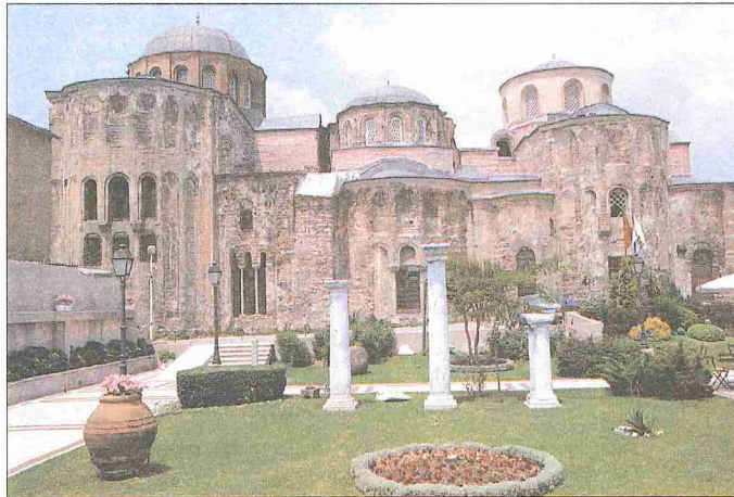
Istanbul'un fethinden sonra camiye (Zeyrek Kilise Camii) çevrilen Pantokrator Manastırı'nın kiliseleri - İstanbul

Pagan Roma'nın hâkim olduğu Filistin topraklarını terkeden ilk hıristiyanların II. yüzyıla kadar götürülebilen tarihlerde Suriye, Irak, Mısır ve Anadolu topraklarında manastır inşa ettikleri bilinmektedir. Müslüman müelliflerin verdiği bilgilere göre İslâm topraklarında yer alan manastırların büyük bir kısmı yerleşim merkezlerinin dışında dağlarda ve çöllerde yapılmış, bazıları ağaçlarla çevrili, güzel manzaralı yüksek mevkilerde veya kollarında inşa edilmiştir. Bir kısmı Dicle, Fırat, Nil gibi nehirlerin kıyısında veya buralara bakan yüksek yerlerde bulunuyordu. Etrafı surlarla çevrili olan bu manastırların bazılarında şifalı kaynak