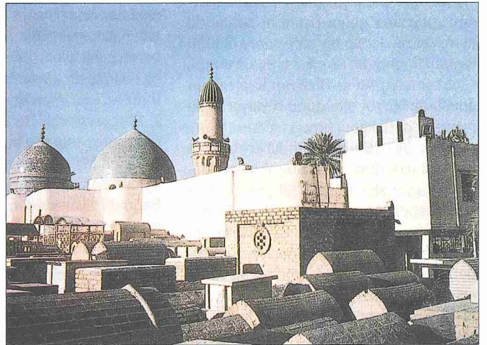
Ma'rûf-i Kerhî Külliyesi - Bağdat / Irak

Ma'rûf-i Kerhî Camii kibleye göre dik düzenlenmiş dikdörtgen planlı bir yapıdır. Giriş bölümünün iki yanında minareye ve mahfile çıkılan merdivenler yer almaktadır. Harim mekânı yarım duvar ve kemerle iki sahna ayrılmıştır. Daha geniş olan batı bölümü ortada kubbe, kuzeyde