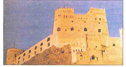
Maskat Kalesi – Uman

şehirde çıkan veba salgını halkın başka yerlere göç etmesine yol açtı. Ancak buharlı motorların icadından sonra Maskat'ın gemiler için kömür deposu haline gelmesi burayı yeniden hareketlendirdi. Şehir konumu itibarıyla yüksek tonajlı gemiler için tabii bir liman teşkil ediyor, dünya ticaretinde bulunan en büyük gemiler dahi buraya uğruyordu. Bugün ise gemiler daha çok Maskat'ın hemen bitişiğindeki Matrah Limanı'na yanaşmaktadır. Halen Maskat Minâ el-Fahl'deki petrol limanı, geniş yolları, düzenli şehirciliğe uygun tünelleri, üst geçitleri, hava alanı ve Sultan Kâbûs Üniversitesi ile Batı şehirlerindeki normları yakalaması bir merkez durumundadır. Son tahminlere göre şehrin nüfusu 410.000, Medîneti-kâbûs, Matrah, Kurum, Ruvî ve Sîb gibi yerleşim yerlerini de ihtiva eden Maskat idarî biriminin nüfusu ise 660.000 civarındadır.