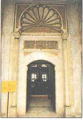
III. Mehmed Türbesi'nin kapısı

ninde yer alan pencerenin kanatlarında yıldızların içleri fildişi kakmalıdır.