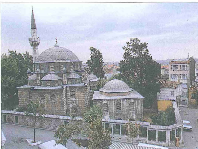
Mehmed Ağa Camii ve Türbesi – Fatih / İstanbul