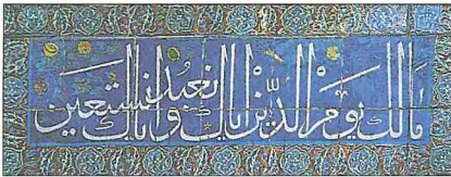
Mehmed Ağa Camii'nin kitâbesi

Mehmed Ağa Camii'nin son cemaat yerindeki çini panolardan biri