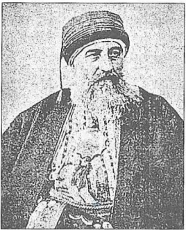
Mehmed Ali Hilmi Dedebaba