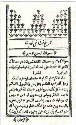
Târîh-i Nişancı'nın ilk sayfasi (İstanbul 1279)