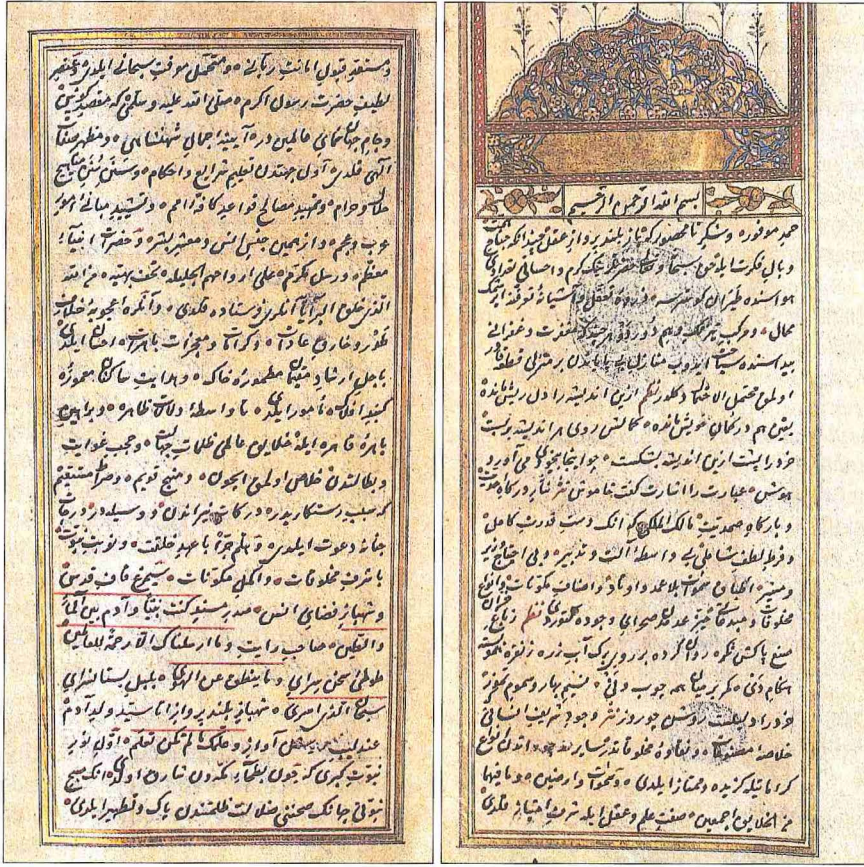
Şâbanzâde Mehmed Efendi'nin Âdâbü'l-hükâm adlı eserinin müellif hattıyla yazılmış nüshasının ilk iki sayfası (Nuruosmaniye Ktp., nr. 4953)

Muhtevasından dolayı eserin ismi bazı nüshalarında Mübâhase-i Seyf ü Kalem ve Münâzara-i Tiğ u Kalem şeklinde de kaydedilmiştir. Kitapta müellife ait Farsça beyitler de bulunmaktadır. Birçok yazması bulunan eserin müellif tarafından istinsah edilmiş iki nüshası Süleymaniye Kütüphanesi'nde kayıtlıdır (Esad Efendi, nr. 3815; Zühdü Bey, nr. 500). 2. Muzhirü'l-işkâl . Mevlânâ Celâleddîn-i Rûmî'nin Meşnevî 'sindeki anlaşılması zor nâdir kelimelerin Türkçe'ye yapılan açıklamalı tercümesidir. Alfabetik olarak sıralanan kelimelerin anlamları için yer yer şahit olarak beyitler yazılmış, zaman zaman uzun açıklamalara ve kısalara yer verilmiştir. Birçok nüshası bulunan eserin müellif tarafından Rebîülevvel 1111 (Eylül 1699), Rebîülevvel 1112 (Ağustos 1700) ve Rebîülâhîr 1113'te (Eylül 1701), istinsah edilen nüshaları Süleymaniye Kütüphanesi'ndedir (Şehid Ali Paşa, nr. 2690; Ayasofya, nr. 4774; Çor-