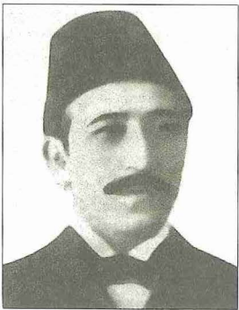
Menemenlizâde Mehmed Tâhir

Özellikle III. Mustafa devrinde 22 Mayıs 1766 depremi sonrasında İstanbul'da başlatılan büyük imar faaliyeti sırasında görev yapan Mehmed Tâhir Ağa'nın birçok yapıda hizmeti mevcuttur. Bu dönemde imparatorluğun diğer bölgelerinde başta kaleler olmak üzere yoğun bir tamir faaliyeti gerçekleştirilmiştir. Bunların önemli bir kısmında planlamayı Mehmed Tâhir Ağa'nın yaptığı anlaşılmaktadır.