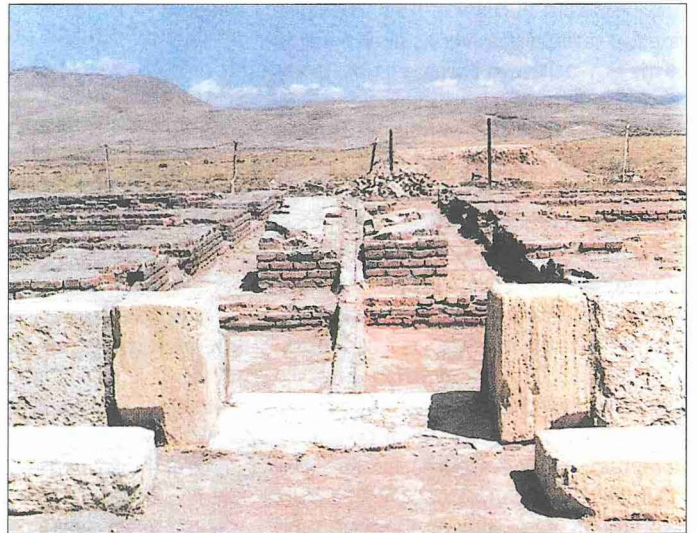
Arkeolojik kazılarla ortaya çıkarılan Merâga Rasathânesi'nin kalıntıları

İlhanlılar'ın yıkılmasının ardından Merâga sırasıyla Celâyirîliler, Timurîlular, Karakoyunlular, Akkoyunlular ve Safevîler tarafından hâkimiyet altına alındı. Osmanlı-Safevî savaşlarında 941 (1534) ve 993 (1585) yıllarında iki defa Osmanlılar'ın eline geçen şehir bir süre de bu devlete bağlı kaldı. III. Murad dönemine ait mücmel tapu tahrir defterinde sancak (livâ) olarak geçtiği ve toplam 492.400 akçe tutan vergi gelirinden 132.200 akçenin hâss-ı hümâyun kaydını taşıdığı görülmektedir (BA, Tapu Tahrir Defteri , nr. 645, s. 33, 99). I. Abbas zamanında (1587-1629) tekrar Safevîler'e bağlanan Merâga, 1136 (1723) yılında bölgenin hâkimi Feridun Han'ın padişaha tâbi olmasıyla bir defa daha Osmanlı hâkimiyetine gir-