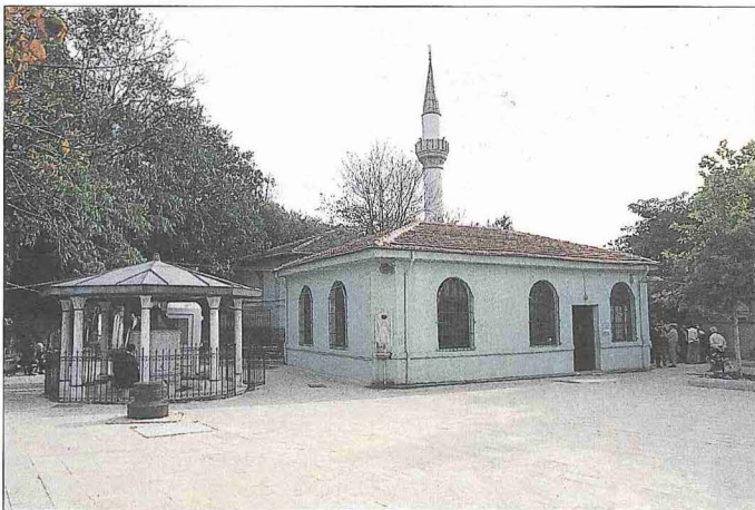
Merkez Efendi Külliyesi'nin türbesi, şadırvanı ve kuyusu

Dârülkurrâ. Klasik Osmanlı üslûbunu yansıtan kare planlı ve kubbeli yapının duvarları kesme küfeki taşıyla örülmüş, kuzey duvarının eksenindeki basık kemerli kapısıyla alt sırayı oluşturan dikdörtgen pencereler mermer sövelerle çerçevesizdir. Bu pencerelerin üzerinde sivri kemerli ve alçı revzenli tepeli pencereleri vardır. Kubbeye geçişi sağlayan trompların etekleri mukarnaslıdır. Asıl dârülkurrâya geçmeden önce yer alan giriş bölümündeki enine dikdörtgen planlı türbede yapıyı inşa ettiren Abdülbâki Paşa ile Sultan Ahmed Camii kürsü şeyhi Mehmed Eşref Efendi'nin kabirleri bulunmaktadır. Girişin üzerindeki sülüs hatlı