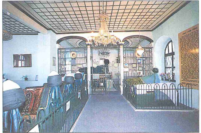
Merkez Efendi Türbesi'nin içinden bir görünüş

Küçük Türbe. Finikeli Şeyh Abdi Efendi ile oğlu Şeyh Mustafa Efendi'nin sandukalarının yer aldığı bu türbe dikdörtgen planlı (4,50 × 3,50 m.), kâgir duvarlı ve kırma çatılıdır. Doğu cephesindeki girişi avluya açılmakta, yanlardan gömme ayaklarla sınırlanmış olan batı cephesinde meydancığa bakan dikdörtgen bir ziyaret penceresi görülmektedir.