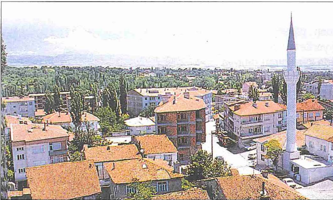
Merzifon'dan bir görünüş

Merzifon, Dânişmendliler'den başlayarak tipik bir Türk-İslâm şehri görünümünü kazanmıştır. Medreseleri, camileri, mescitleri, tekke ve türbeleriyle, çeşitli hayır kuruluşlarıyla bezenen şehir, aynı zamanda Bedesten'i ve Taşhan'ı ile ticaret açısından da önemli bir konumdaydı. Antik iç kale şehrin ortasındaki tepelik mevkide bulunuyordu. Dış kale ise tepenin eteklerinde olup bugüne ulaşmamıştır. Merzifon'da en eski âbide günümüzde kitabesi, iki kanat kapısı ve minberi kalan Mu'nüddin Pervâne Süleyman Camii'dir (Ulucami). 663 (1265) tarihli kitabesi bulunan ve 1904'te yanan bu caminin bugünkü Yokuşbaşı semtinde Eskicami sokağı başında bulunduğu tahmin edilmektedir. Câmî-i Cedîd mahallesindeki Çelebi Sultan Mehmed Medresesi (817/1414), İmaret mahallesinde 822 (1419) yılında Çelebi Mehmed'in annesi ve Germiyanlı Süleyman Şah'ın kızı Devlet Hatun'un bir cami ve zâviye ile birlikte yaptırdığı imareti, Çelebi Sultan Mehmed Camii olarak bilinen, fakat aslında II. Murad tarafın-