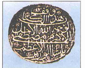
Merzifonlu Kara Mustafa Paşa'nın vakıf mührü