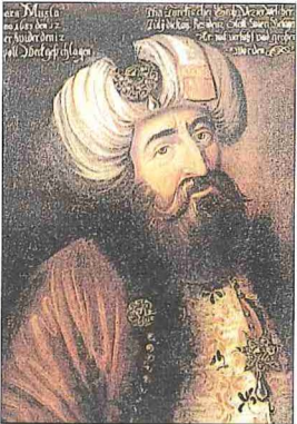
Merzifonlu Kara Mustafa Paşa'nın yağlı boya bir resmi (Museum der Stadt Wien)