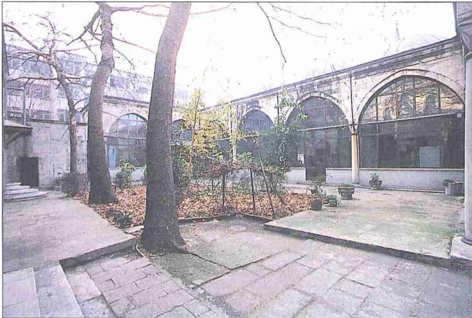
Merzifonlu Kara Mustafa Paşa Medresesi avlusundan bir görünüş

Avlunun güneydoğusunda bulunan sıbyan mektebi dikdörtgen planlı olup üzeri ahşap tavanlı, kurşun kaplı bir çatıyla örtülüdür. Medrese avlusundan kısmen tecrit edilen yapının güneyindeki girişi önünde küçük bir avlu vardır. Güneydoğudaki avlu duvarı üzerinde yer alan küçük bir kapı ile dışa bağlanan yapının doğu ve güney cepheleri iki sıra tuğla, bir sıra kesme köfeki taşından almaşık örgü-