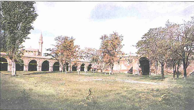
Merzifonlu Kara Mustafa Paşa Kervansarayı - İncesu / Kayseri

Kervansaray. Tesisin ana yapısını oluşturan ve doğuda yer alan iki bölümlü kervansarayı güney yönünde "U" şeklinde düzenlenmiş revaklı avlusu ile bunun kuzeyinde kapalı bölümü bulunmaktadır. Kareye yakın yamuk bir alanı kaplayan avlunun İncesu deresine bakan cephesi dıştan dokuz payanda ile takviye edilmiştir. Avlunun doğu yönünde dışa açılan, batı yönünde ise arastaya bağlanan iki kapısı vardır. Kare kesitli ayaklara oturan sivri kemerli revaklardan doğudakiler çapraz tonoz, batı ve kuzeydekiler beşik tonozla örtülüdür. Yalnızca batı revakının kuzey ucundaki bir mekânla güneydeki iki birim çapraz tonozludur. Revakların her birinde duvarlara yerleştirilmiş ocak nişleri bulunmaktadır. Taş konsollara oturan basık kemerli ocakların iki yanında simetrik küçük kemerli nişler mevcuttur. Güneydoğu köşesinde bugün mevcut olan küçük bir parçadan anlaşıldığına göre revakların içleri eskiden bir sekiyle çevrelenmişti. Güneydoğu köşesinde yer alan ve küçük bir kapı ile bağlantılı olan mekânın vaktiyle üst kata geçişi sağlayan merdiven kulesi olduğu tahmin edilmektedir. Avlunun kuzeybatı köşesinde mevcut bir kapı ile burada bulunan helâlâlara bağlantı sağlanmıştır. Avlunun kuzeyindeki kapalı bölüm revaklara göre daha yüksek tutulmuştur. Cephede dışa taşkın kemerli giriş bölümü beşik tonozlu bir eyvan gibi düzenlenmiştir. Kapı üzerinde 1081