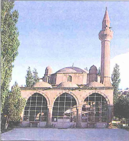
Merzifonlu Kara Mustafa Paşa Camii - İncesu / Kayseri