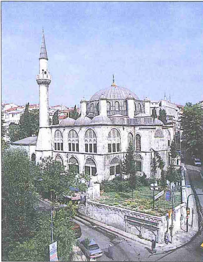
Mesih Paşa Camii – Fatih / İstanbul

Yapının bânisi Mesih Mehmed Paşa'nın sekizgen açık türbesi konumuyla dikkati çeker. Avlunun ortasına şadırvanı görmeye alıştığımız yere inşa edilen türbe kla-