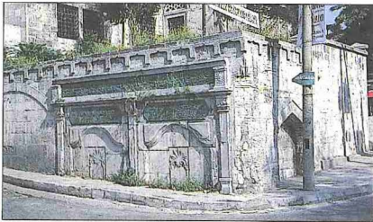
Mesih Paşa Külliyesi'nin avlu duvarı köşesindeki çeşme

Eserleri. 1. Divan . Yirmi biri kaside, 294'ü gazel olmak üzere 350'ye yakın şiir ihtiva eden eserin Türkiye dışında ve Türkiye'deki kütüphanelerde yazma nüshaları vardır (British Museum, Or., nr. 1152;