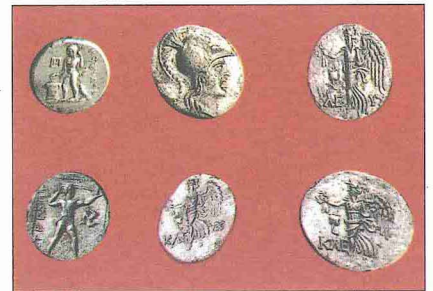
Antik döneme ait bazı sikke örnekleri

XVII ve XVIII. yüzyıllarda özel koleksiyoncuların yerini kamu müzeleri almaya başladı. Bazı büyük koleksiyonları satın