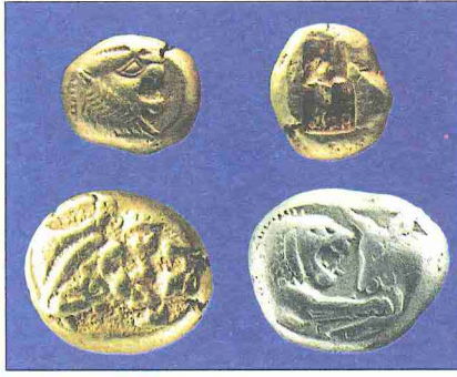
Milâttan önce VI. yüzyılda Lydia'nın başşehri Sardes'te darbedilen altın ve gümüş sikkeler

Sözlükte “üzerine damga vurulmuş” anlamına gelen meskûkûn çoğulu olan meskûkât , damgalanarak sikke haline dönüştürülmüş madenî paraları / sikkeleri ifade eder. Ayrıca bu kelime sikkelerle uğraşan bilim dalı olan nümismatik karşılığı da kullanılmıştır. Osmanlılar’da XIX. yüzyılın sonlarından itibaren müzecilik alanındaki gelişmelere paralel olarak ortaya çıkan sikke incelemelerine ilm-i meskûkât denmiş ve bu terkip daha sonra yerini nümismatik e bırakmıştır. Eski Yunan’da “kanun” anlamında kullanılan