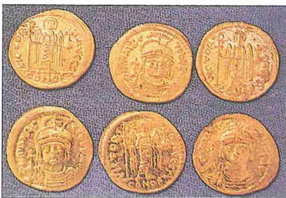
Bizans altın sikkeleri

63'te (682) Medine'de doğdu. Emevî Halifesi Abdülmelik b. Mervân'ın oğludur. "el-Cerrâdetü's-safrâ" (sarı çekirge) lakabıyla tanınır. Annesi bir câriyedir. Dört