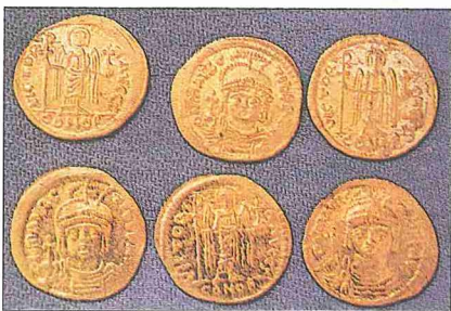
Bizans altın sikkeleri

63'te (682) Medine'de doğdu. Emevî Halifesi Abdülmelik b. Mervân'ın oğludur. "el-Cerrâdetü's-safrâ" (sarı çekirge) lakabıyla tanınır. Annesi bir câriyedir. Dört